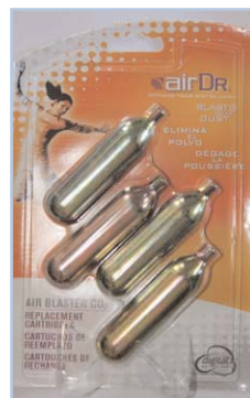
Codice - R4

Air Blaster E' uno spray ad anidride carbonica (CO 2 ) che rilascia il gas ad a velocità superiori delle normali bombolette in commercio. Caratteristiche principali di questo prodotto sono:- non c'è rilascio di umidità - non infiammabile - oil-free - Rispetta l'ambiente ( non rilascia CFC e HCF) - alta velocità Completo di due ricariche da 16 gr.