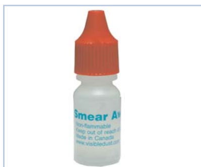
Codice - 2351918-1