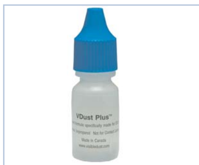
Codice - 2902544