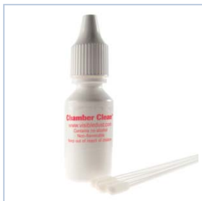
Codice - 2291206

Visible Dust consiglia di non utilizzare altre soluzioni per non contaminare il sensore