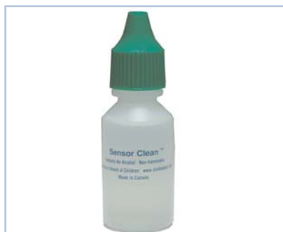
15 ML - Codice - 2291205-1