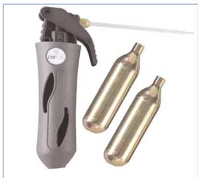
Codice - ABCO2