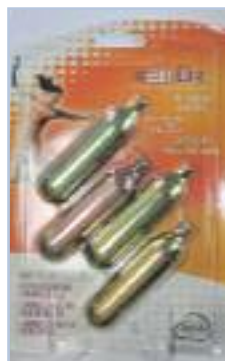
Codice - R4

Air Blaster E' uno spray ad anidride carbonica (CO 2 ) che rilascia il gas ad a velocità superiori delle normali bombolette in commercio. Caratteristiche principali di questo prodotto sono:- non c'è rilascio di umidità - non infiammabile - oil-free - Rispetta l'ambiente ( non rilascia CFC e HCF) - alta velocità Completo di due ricariche da 16 gr.