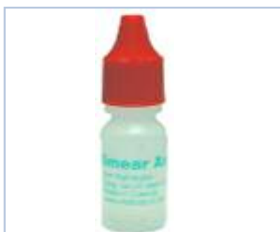
Codice - 2351918-1