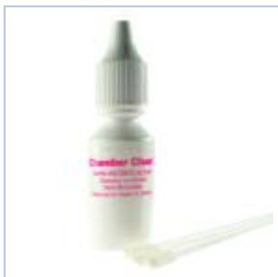
Codice - 2291206

Visible Dust consiglia di non utilizzare altre soluzioni per non contaminare il sensore