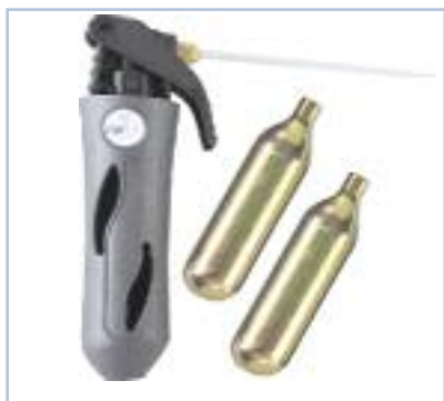
Codice - ABCO2