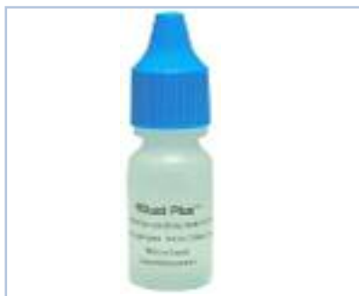
Codice - 2902544