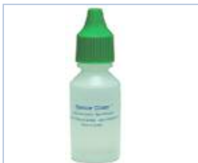
15 ML - Codice - 2291205-1